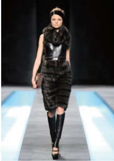
Abito di zibellino con bustino di cuoio. Creazione Fendi. Sable dress with leather bodice. Creation Fendi.